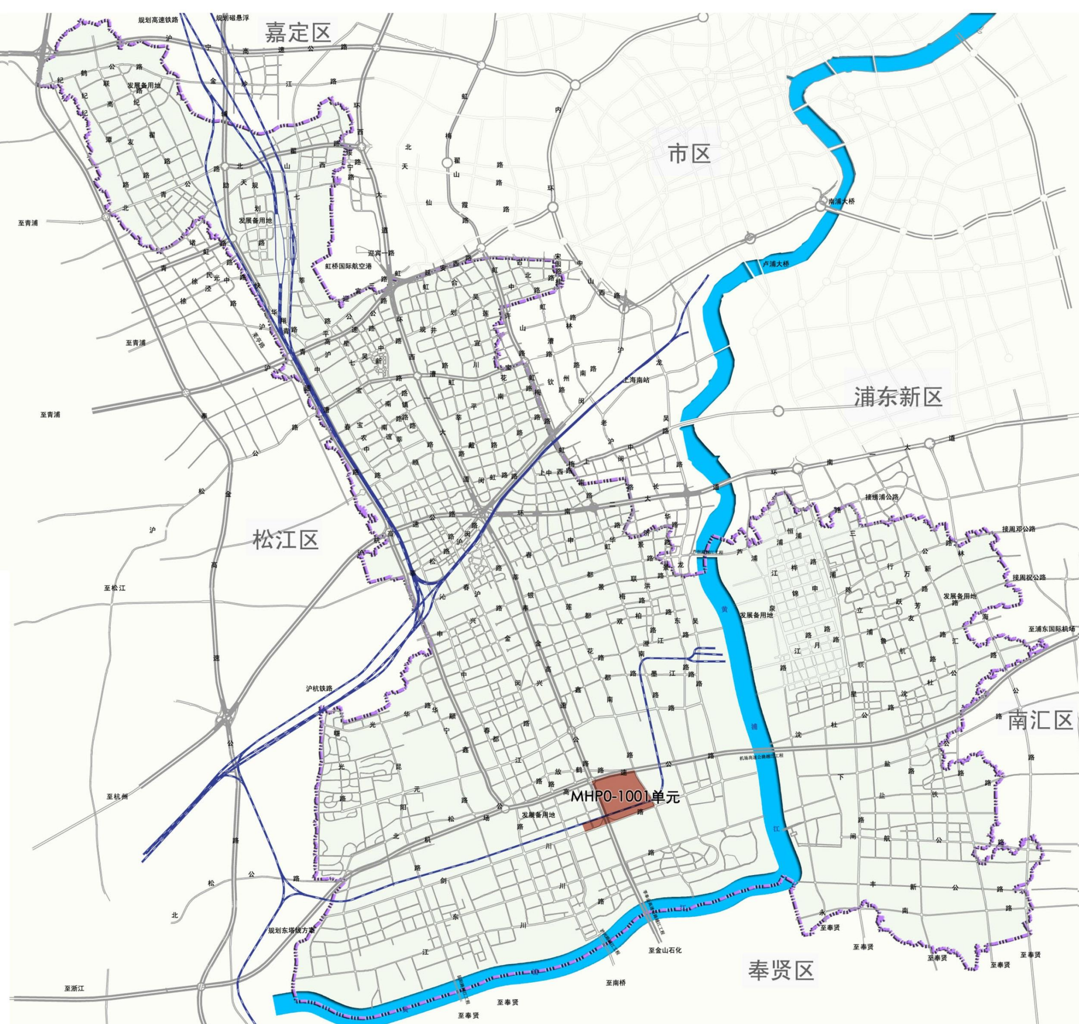
MHP0-1001单元在闵行区的位置