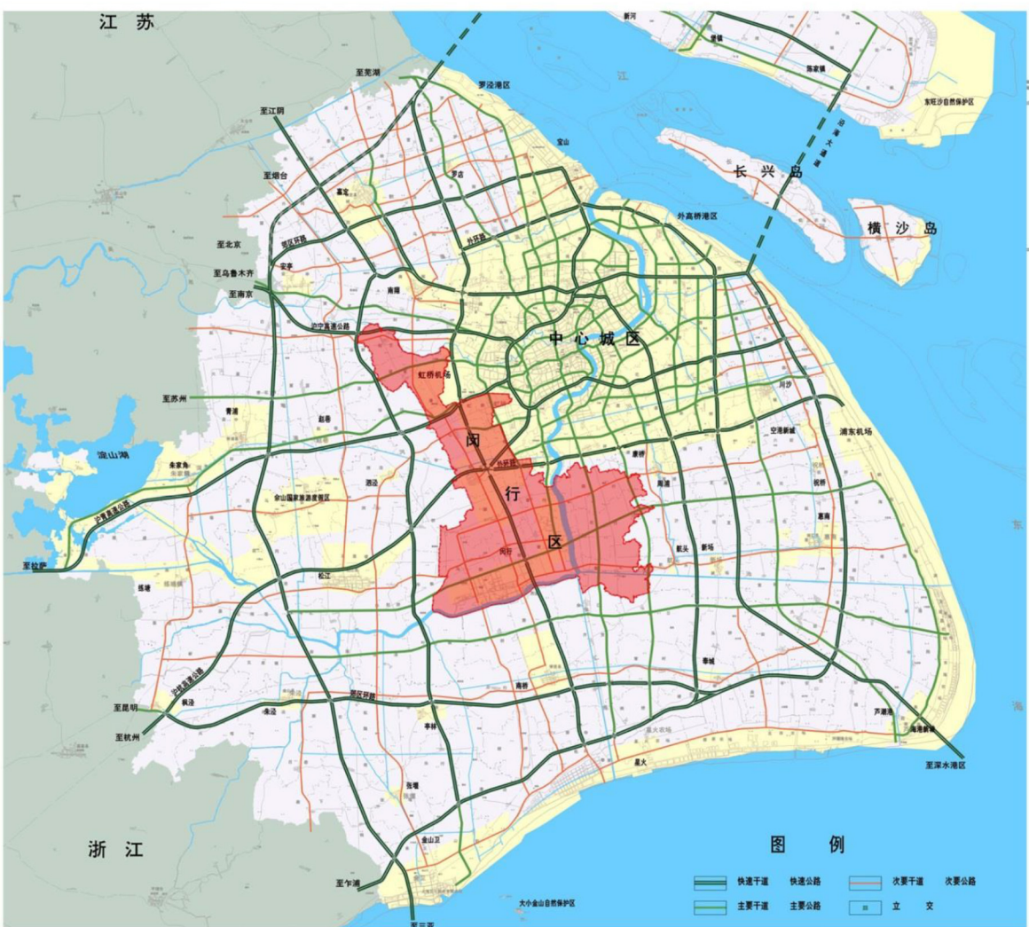
闵行区在上海市的位置

本次规划调整涉及MHP0-0304单元02-11街坊02-11-06地块。02-11街坊四至范围为：东至兴南路、南至锦梅路、西至虹梅南路、北至外环高速，总用地面积约为31.43公顷。