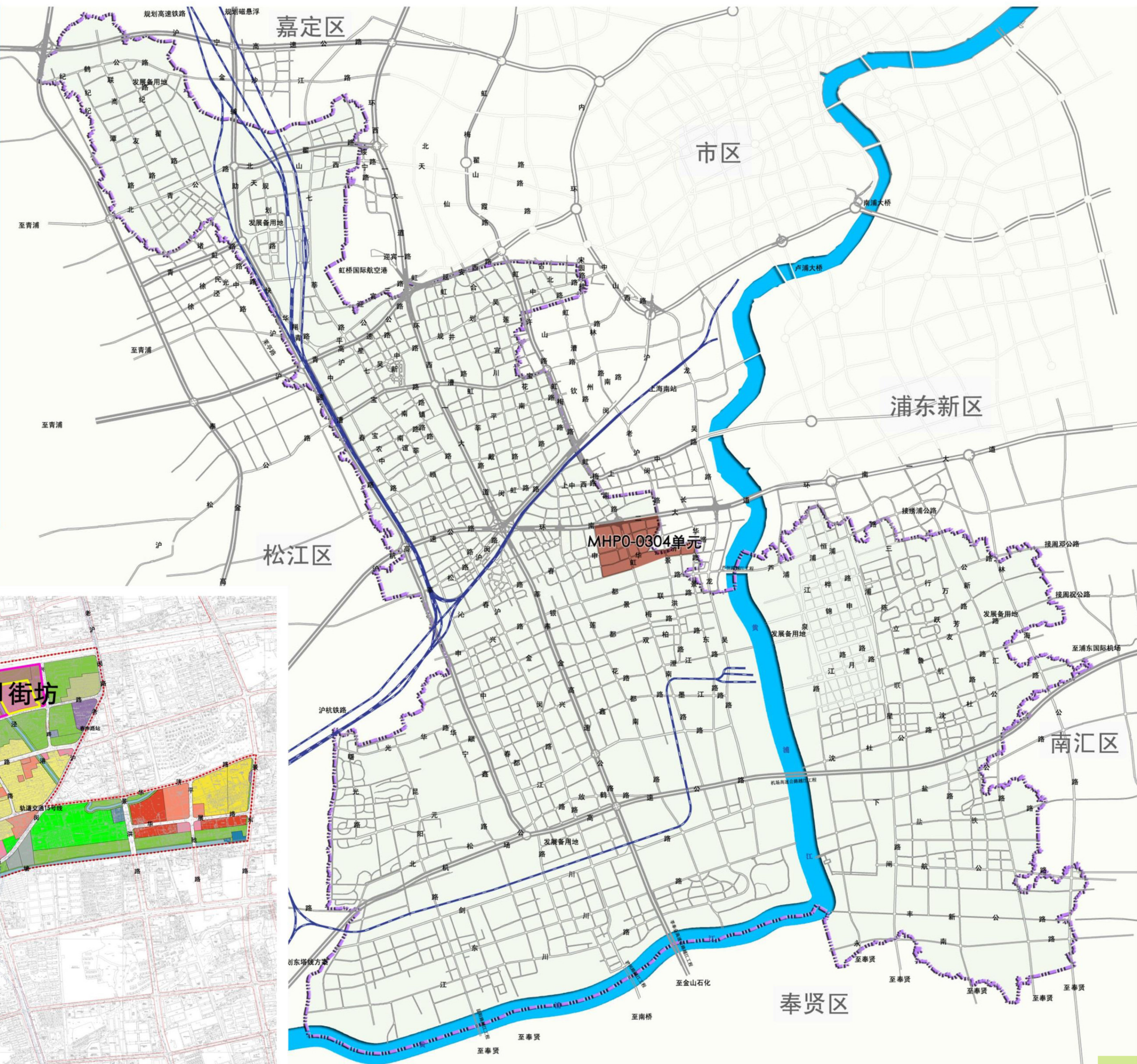
MHP0-0304单元在闵行区的位置