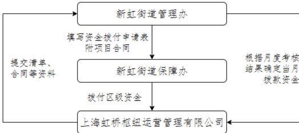
图 1.2 资金拨付流程图