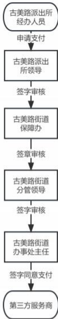
图 1 资金拨付流程图