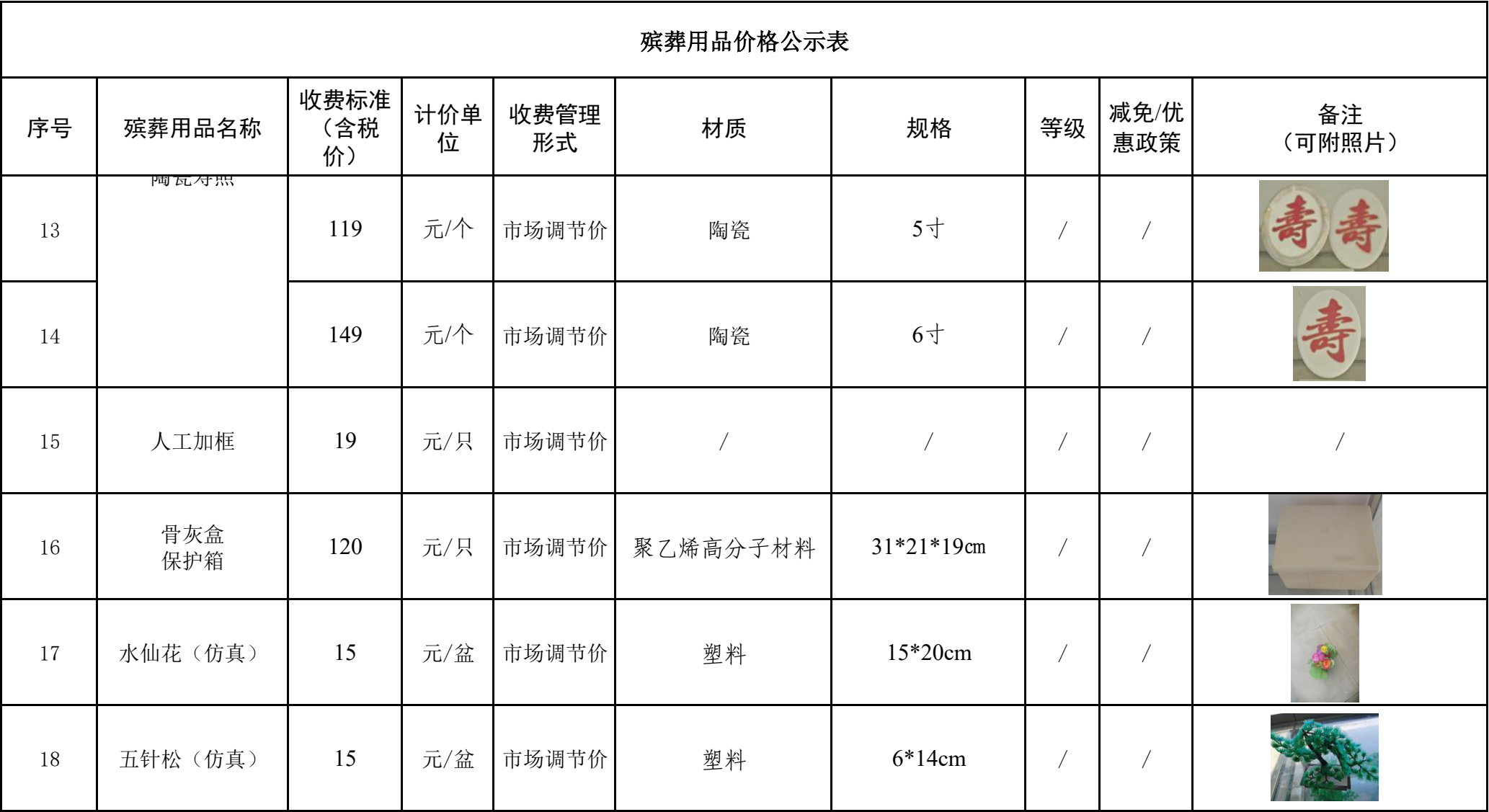
殡葬用品价格公示表