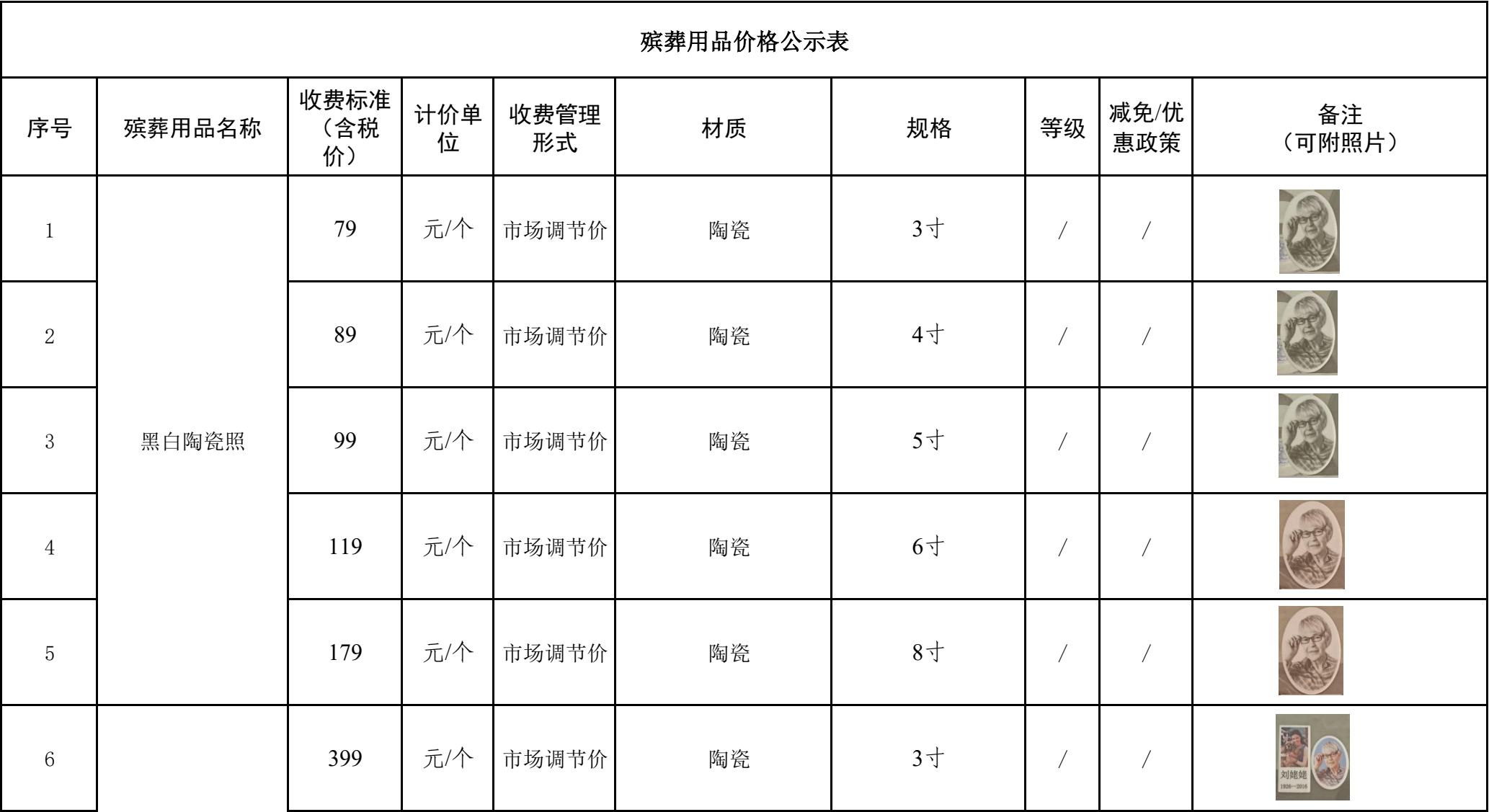
殡葬用品价格公示表